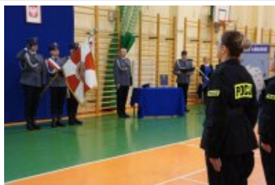
ślubowanie nowo przyjętych policjantów