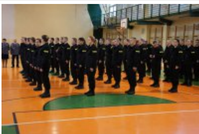
nowo przyjęci policjanci

Informujemy, że w oparciu o cyklicznie dokonywaną w 2016 r. analizę fluktuacji kadr w Policji, Komendant Główny Policji może dokonywać ewentualnej modyfikacji ww. terminów i limitów przyjęć do służby.