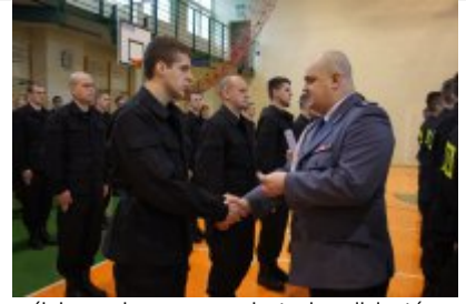
ślubowanie nowo przyjętych policjantów