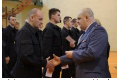
ślubowanie nowo przyjętych policjantów