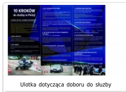
Ulotka dotycząca doboru do służby