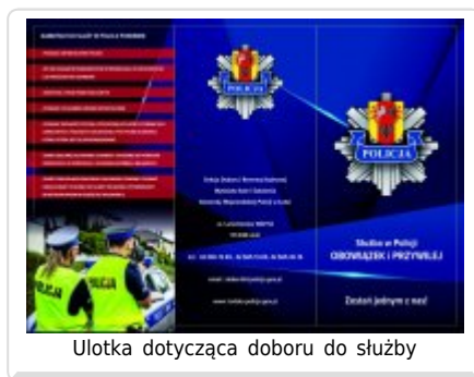
Ulotka dotycząca doboru do służby